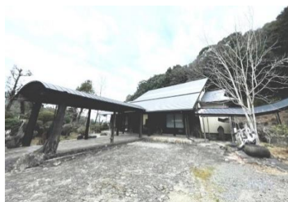
高知建機技能センター 教習所

宿泊希望者には、宿泊施設・移動手 段をご紹介致します。必要であ れば、お気軽にお問い合わせくだ さい。