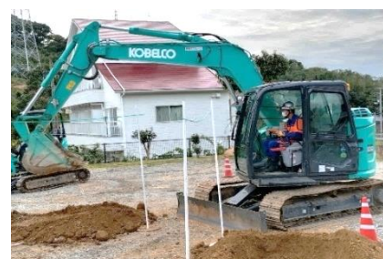
車両系建設機械(整地等)