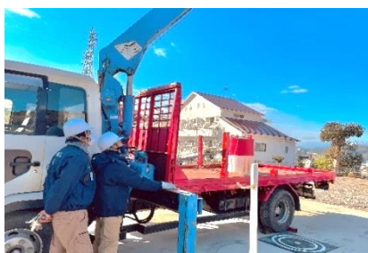
小型移動式クレーン